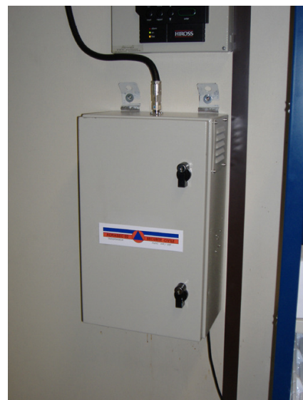
figure n : ° 2 : Le relais transpondeur