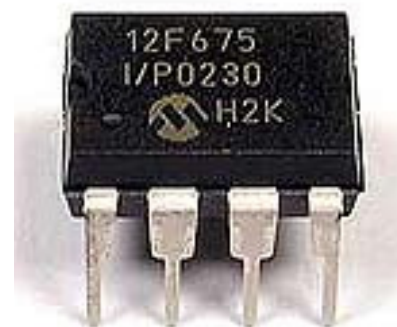
Figure 2 : Le microcontrôleur retenu

Ce microcontrôleur ne disposant que de 64 octets de RAM et 1K mots de mémoire programme nous devons mettre au point un algorithme sobre en ressources mémoires.