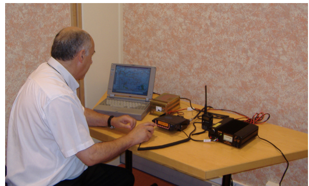
Figure n : ° 2 : responsable de zone utilisant le transpondeur au sein de la préfecture

Ce transpondeur a été installé dans les locaux de la préfecture de Laon. Il est pleinement opérationnel depuis mars 2007 et utilisé régulièrement au moins une fois par mois et notamment lors des exercices et plans d'urgence (voir figure n° 2 et 3).