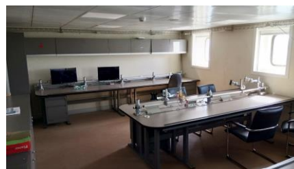
fig 2 : Laboratoire polyvalent du Marion Dufresne.

Le navire transporte aussi le carburant destiné à la production d'énergie sur les bases. Le carburant stocké dans les soutes est transféré sur les bases à l'aide d'une manche à gazoil placée sur un enrouleur. Ce dernier permet la mise à l'eau de la manche sur plusieurs centaines de mètres. Le transfert du carburant se fait sous pression entre le navire et les unités de stockage des bases. Le navire en lui-même est source de curiosité pour les étudiants. Entre les missions de ravitaillement il est affrété par l'IFREMER (Institut Français de Recherches pour l'Exploitation de la MER) pour des missions de recherche avec une capacité de 650 m 2 de laboratoire (cf. fig 2 ), un système de treuillage, un sondeur multi faisceaux et un carottier [5] .