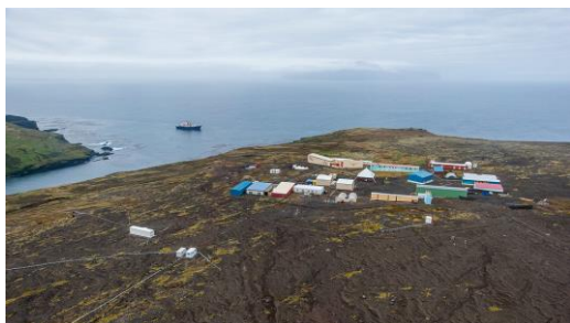
fig 1 : Vue aérienne de la base Alfred Faure. Au large le Marion Dufresne.

La faune des îles Crozet comprend principalement des oiseaux de mer parmi lesquels les pétrels, de grandes colonies de manchots et des albatros. À l'intérieur du pays, autour des étangs, on peut trouver des canards sauvages. Les îles abritent l'une des plus importantes populations de mammifères marins. Leurs eaux très productives forment une "oasis" nourricière pour ces espèces. Les éléphants de mer viennent chaque année très nombreux le long des côtes. Les baleines sont également fréquentes en hiver.