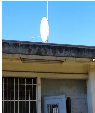
fig 6 : Antenne parabole sur le toit du bâtiment abritant la salle de Travaux Pratiques et la Station Sol.

La plupart des composants viennent des fournisseurs classiques de composants électroniques ou radioamateurs, mis à part pour deux éléments, le minitiouner distribué par le REF et l'amplificateur de puissance faible coût distribué par une société basée en Bulgarie. Cet amplificateur peut être également conçu et fabriqué localement. Il est cependant intéressant de le doubler par l'amplificateur commercial pour des raisons de fiabilité.