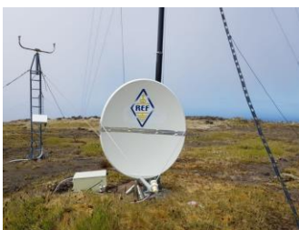
fig 3: Boîtier contenant l'électronique de la station et parabole sur l'île de la Possession